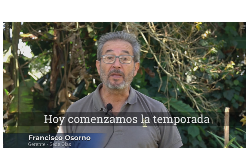
Apertura del pico: El inicio de una gran temporada.

El amor por lo que hacemos florece en cada detalle. En esta temporada productiva, quisimos resaltar la esencia de las flores y el esfuerzo de nuestra familia Trigal con mensajes que inspiran y unen.