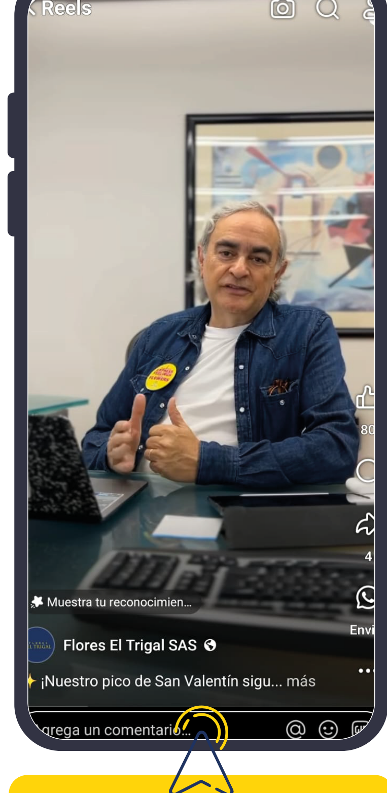
Los invitamos a ver este video donde Golden Flowers nos da las gracias por el trabajo durante esta temporada.

Este ha sido un periodo clave, donde la eficiencia en la producción, distribución y comercialización son cruciales para que nuestras flores lleguen al destino final y puedan ser entregadas a quienes quieren expresar su amor.